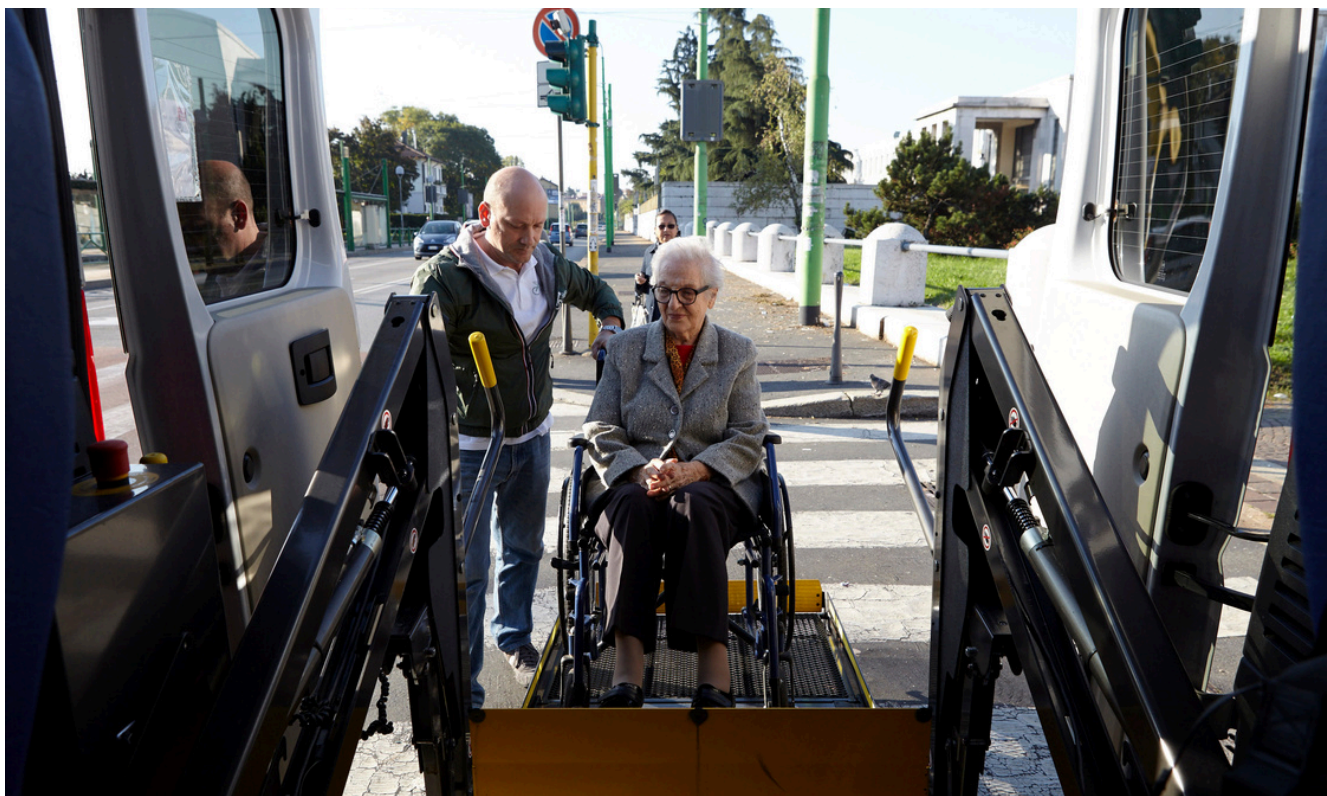
FOTO RELATIVA AL PROGETTO ADOTTA UN PULMINO

In questa rendicontazione illustriamo gli obiettivi, le modalità di attivazione del Progetto AP e le testimonianze dei beneficiari, indicando e rapportando agli anni precedenti il numero di utenti e delle corse effettuate nel 2023 divise per tipo di servizio (continuativi, occasionali, collaborazioni). Infine, indichiamo i costi sostenuti e le donazioni ricevute con il disavanzo coperto da A.l.a.t.Ha. nel 2023 rilasciando i commenti finali.