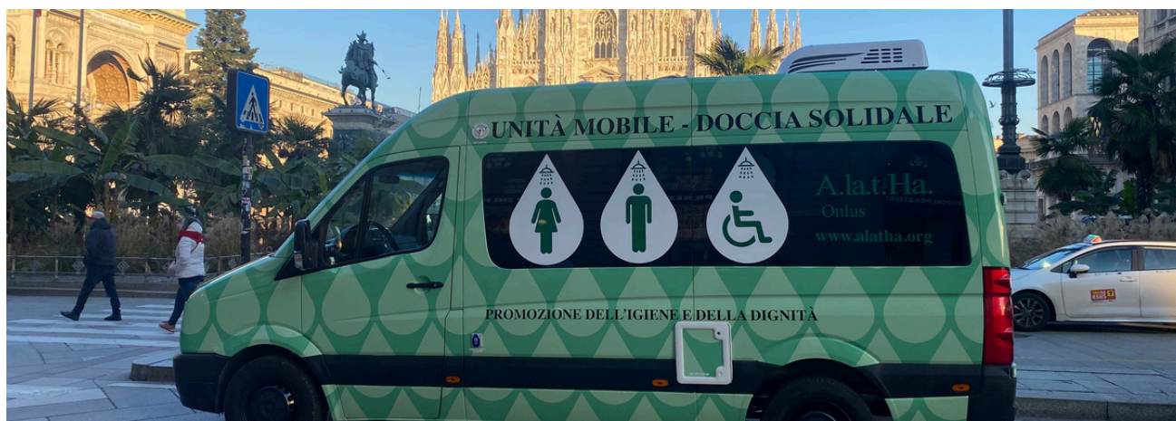
Unità mobile docce solidali -Rispetto e Dignità In Movimento

L'obiettivo primario del progetto è quello di creare le condizioni affinché il senza tetto possa uscire definitivamente dalla strada offrendo un servizio di promozione dell'igiene e dignità attraverso un'Unità Mobile - Docce Solidali. Vogliamo dare ai senza tetto coraggio, autostima e speranza